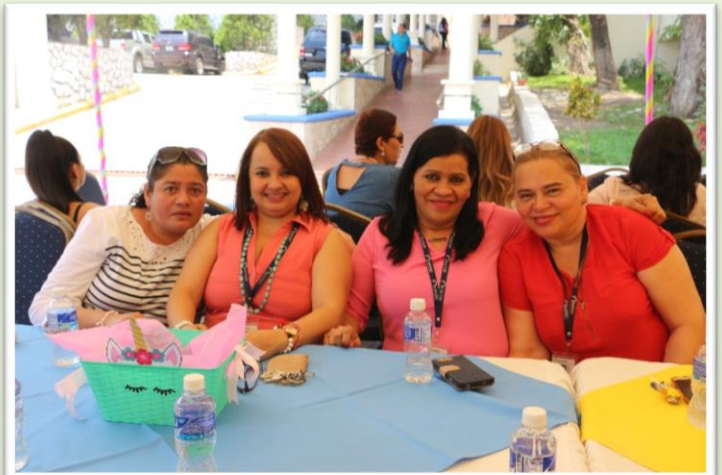
Instantes para nunca olvidar... el día de las madres de INJUPEMP.

Las homenajeadas degustaron de un exquisito almuerzo que incluyó cordon blue de pollo, puré de papas, ensaladas verde y vegetales acompañado de un rico postre.