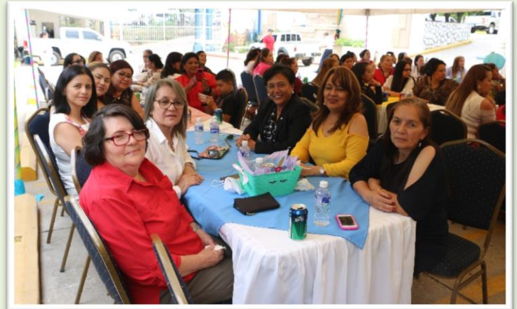
Un elegante ramo de flores... las madres de INJUPEMP.

El acontecimiento inició con la invocación a Dios por parte de Pedro Vargas, posteriormente se ofreció un minuto de silencio por las madres ausentes en la vida de sus hijos e hijas del INJUPEMP y por las compañeras de labores que descansan en la paz del Señor.