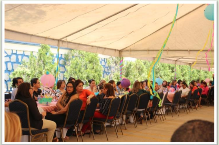
Las madres de INJUPEMP.

“Muchas felicidades que Dios nos bendiga a todas, que nos siga dando amor para multiplicarlo en nuestros hijos y que nos siga guiando para poder educar y apoyar a nuestros hijos”.