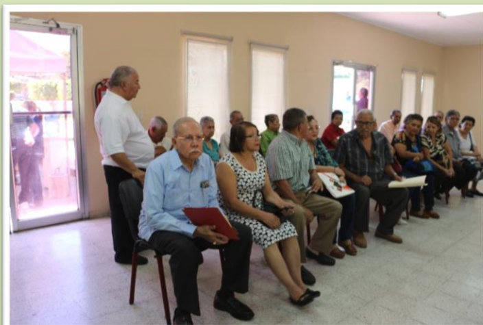
En vista de la enorme cantidad de pensionistas, se atienden por grupos y se instalan dentro del salón tipo auditorio del Centro de Día, donde hay aire acondicionado, baños, sillas y el personal de Servicios Sociales les indica el procedimiento a seguir para practicarse la Prueba de Supervivencia.