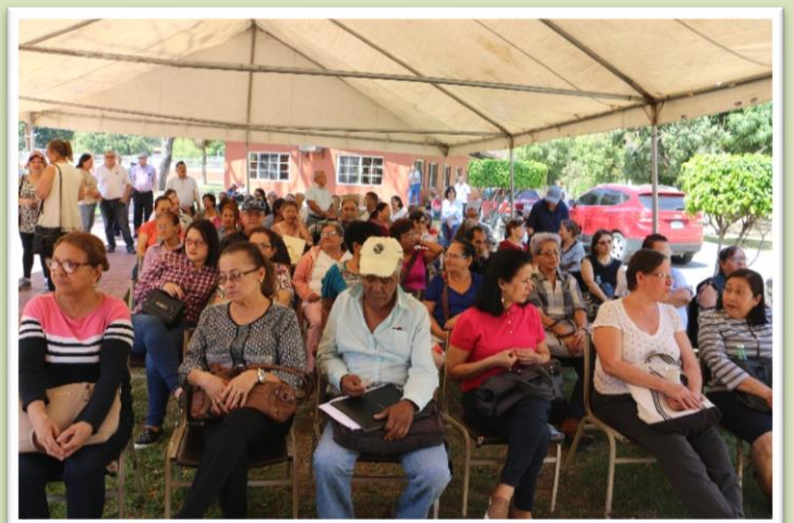
Más de quince mil personas serán las que se practiquen esta Prueba de Sobrevivencia que hace INJUPEMP por mandato de la ley. En el Centro de Día en Germania se han instalado carpas y sillas para comodidad de los asistentes.

Los convocados deben presentar la tarjeta de identidad (aplica también para pensionados por viudez), nombre y número de identidad de su cónyuge, dirección exacta de su lugar de residencia, nombre y número de teléfono de una persona como referencia personal, y el nombre y número de identidad o fecha de nacimiento de sus beneficiarios.